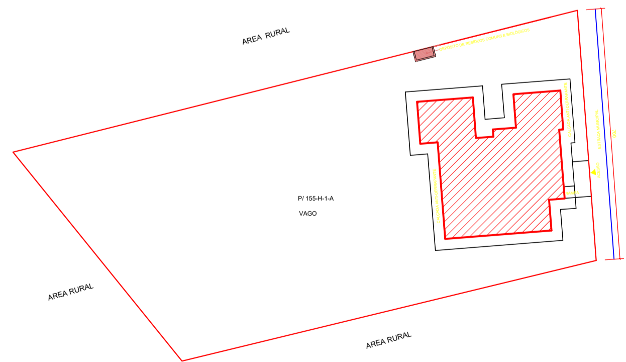
PLANTA DE SITUAÇÃO ESCALA 1:250

OBS: PINTURA EXTERNA E INTERNA NA ÁREA EXTERNA SERÁ PASSADO TEXTURA NA ÁREA INTERNA SERÁ PASSADO MASSA CORRIDA